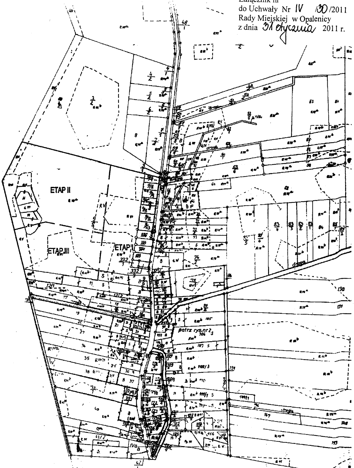
Rys nr 3 1:500

Załącznik nr do Uchwały Nr IV 130/2011 Rady Miejskiej w Opalenicy z dnia 31 stycznia 2011 r.